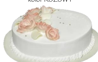
Wzór dekoracyjny 8 (16p/24p na śmietanie)