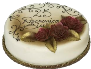
Wzór dekoracyjny 1 (16p/24p masa cukrowa)

Tort średni dekoracyjny: (ok. 16 porcji) Ø 230 mm - koszt dodatkowy: 285 zł Tort duży dekoracyjny: (ok. 24 porcji) Ø 280 mm - koszt dodatkowy: 330 zł Tort prostokątny dekoracyjny: (ok. 32 porcji) 30x40 cm - koszt dodatkowy: 445 zł