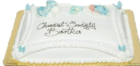
Wzór dekoracyjny 12 (32p/64p na śmietanie) - kolor NIEBIESKI -

🌸 Dostępne smaki w dekoracji z białej śmietany: (wzór: 5, 6, 7, 8, 9, 10, 11, 12) Królewski, Truskawkowy, Jeżynowy, Cytrynowy, Czekoladowo-Śmietankowy Beza z Adwokatem, Czekoladowy