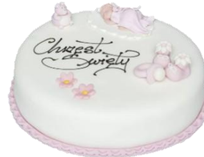
Wzór dekoracyjny 4 (16p/24p masa cukrowa) - kolor RÓŻOWY -