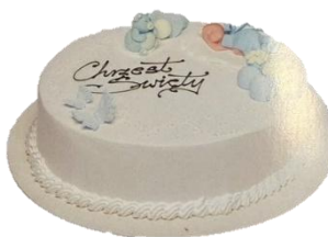
Wzór dekoracyjny 5 (16p/24p na śmietanie) - kolor NIEBIESKI -