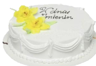
Wzór dekoracyjny 7 (16p/24p na śmietanie)