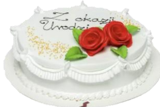
Wzór dekoracyjny 6 (16p/24p na śmietanie)