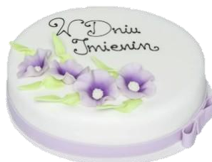
Wzór dekoracyjny 3 (16p/24p masa cukrowa)