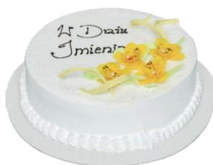
Wzór dekoracyjny 9 (16p/24p na śmietanie)