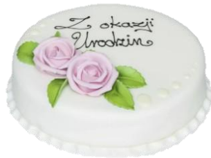
Wzór dekoracyjny 2 (16p/24p masa cukrowa)