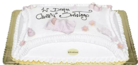
Wzór dekoracyjny 11 (32p/64p na śmietanie) - kolor RÓŻOWY -